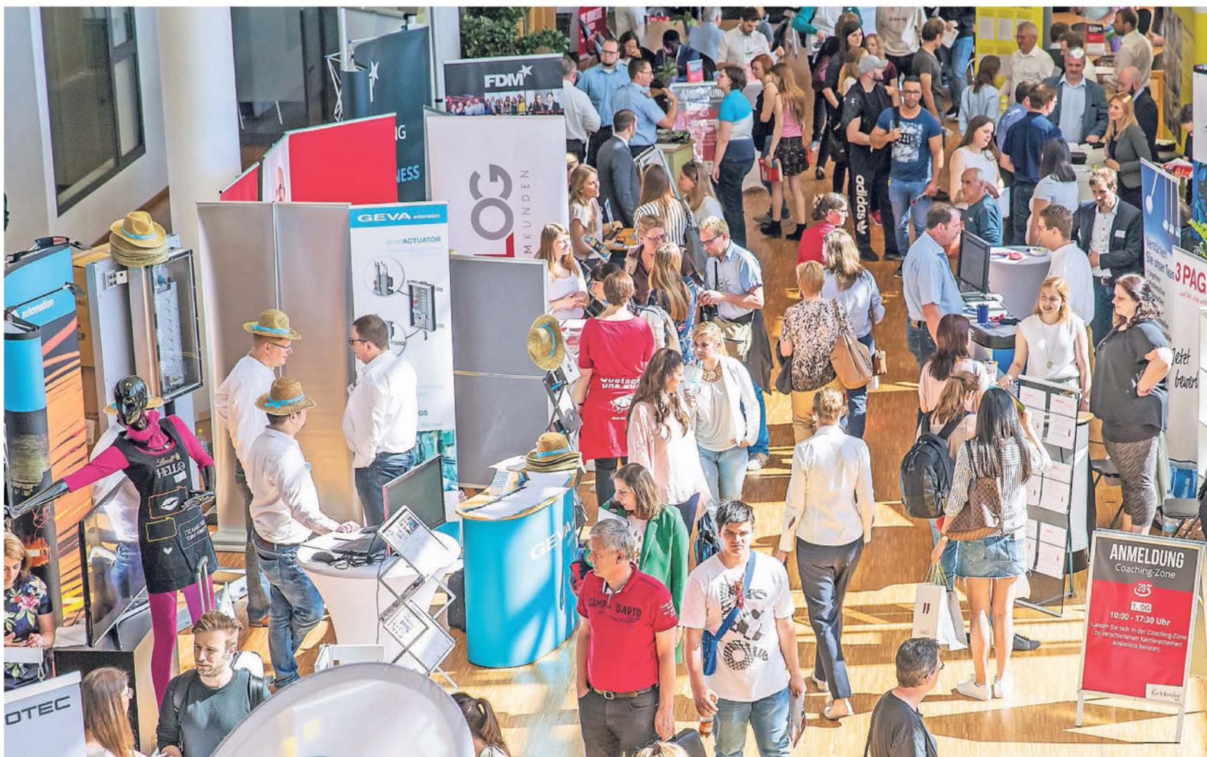
Mehr als 40 Unternehmen haben sich für den Karrieretag in der Historischen Stadthalle am Mittwoch, 6. November, angemeldet.

Stellensuchende sind gut beraten, ihre Bewerbungsunterlagen wie das Anschreiben und