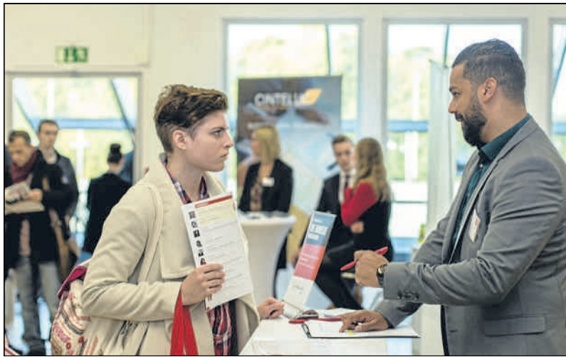
Beim Karrieretag kommen die Bewerber mit den Personalverantwortlichen der Unternehmen ins Gespräch.

Businessstaugliche Kleidung und vollständige Bewerbungsunterlagen machen einen guten ersten Eindruck. Zudem sollten Bewerber im Vorfeld die Situation eines Vorstellungsgesprächs durchspielen und sich Antworten auf Standardfragen überlegen.