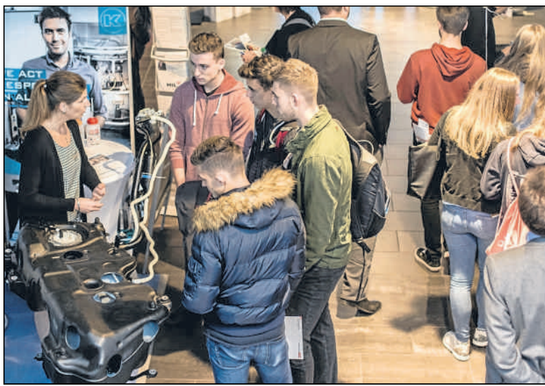
Alljährlich lockt der Karrieretag viele Besucher in den Telekom Dome.